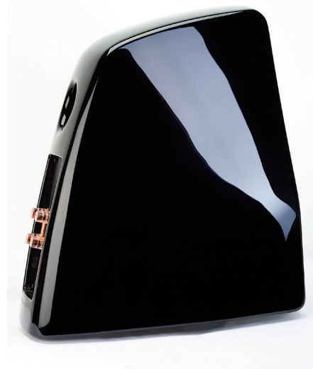
M2-lådan gjuts i två delar som sammanfogas och lackas till sin fina, svarta lyster.