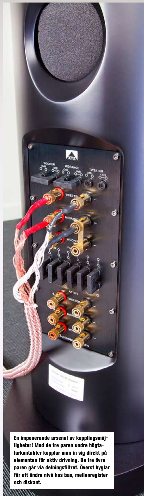
En imponerande arsenal av kopplingsmöjligheter! Med de tre paren undre högtalarkontakter kopplar man in sig direkt på elementen för aktiv drivning. De tre övre paren går via delningsfiltret. Överst byglar för att ändra nivå hos bas, mellanregister och diskant.

Längst ner på baksidan sitter tre anslutningar som sjar om framtiden. Denna uppsättning är till för helt aktiv drift och mellan raderna berättar den även att XTZ håller på att ta fram en förstärkarlösning med aktiva filter och DSP, liknande den som återfinns i märkets Sub Amp1 DSP-slutsteg.